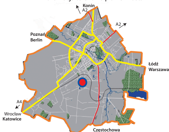
Lokalizacja terenu na planie miasta

Teren położony w dzielnicy Zagorzynek na obszarze strefy przemysłowej pomiędzy odcinkiem linii kolejowej nr 14; w pobliżu droga krajowa Nr 25 .